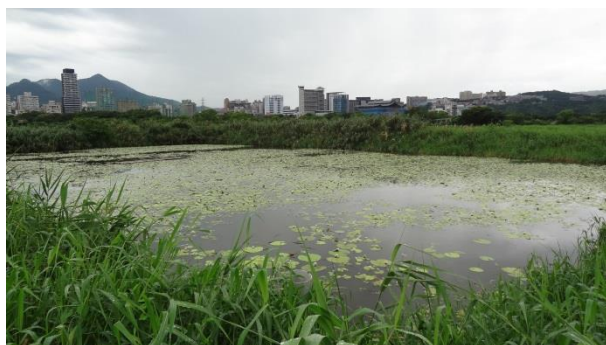
▲11 號池浮葉植物