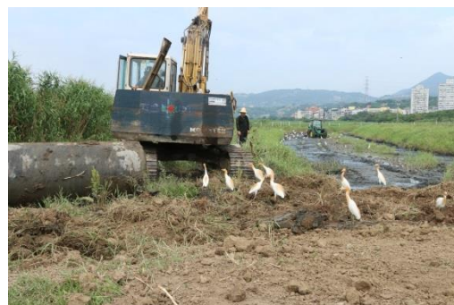
▲水田模式的棲地復育工程