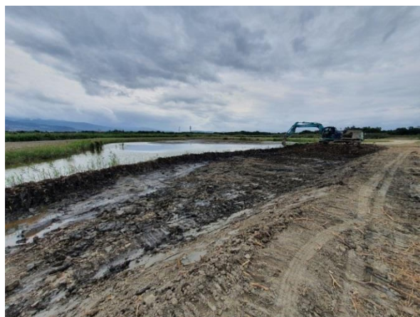
▲棲地復育工程-土方外運擴大 6 號池

五、今年 12 月在關渡自然公園內的鴨群數量是 2008 年以來的最大量，12 月記錄的小水鴨超過了 3500 隻，這是值得欣喜的事！而另一方面，管理處今年也努力暫緩了開發保育核心區的計畫，包括開放遊客進入保育核心區域參觀的議案，以及興建步道通過保育核心區的計畫。