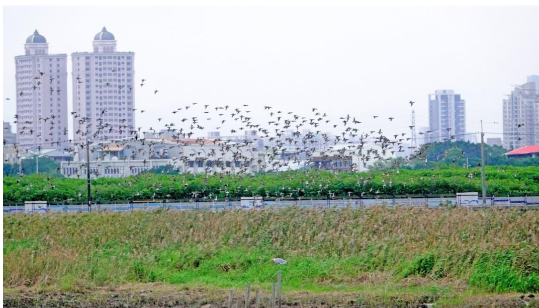
▲鴨群多多

五、今年 12 月在關渡自然公園內的鴨群數量是 2008 年以來的最大量，12 月記錄的小水鴨超過了 3500 隻，這是值得欣喜的事！而另一方面，管理處今年也努力暫緩了開發保育核心區的計畫，包括開放遊客進入保育核心區域參觀的議案，以及興建步道通過保育核心區的計畫。