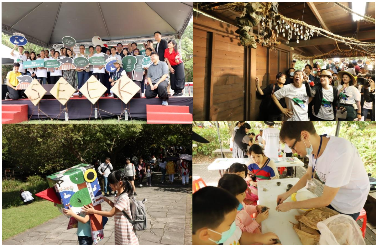
▲ 第 15 屆關渡國際自然藝術季