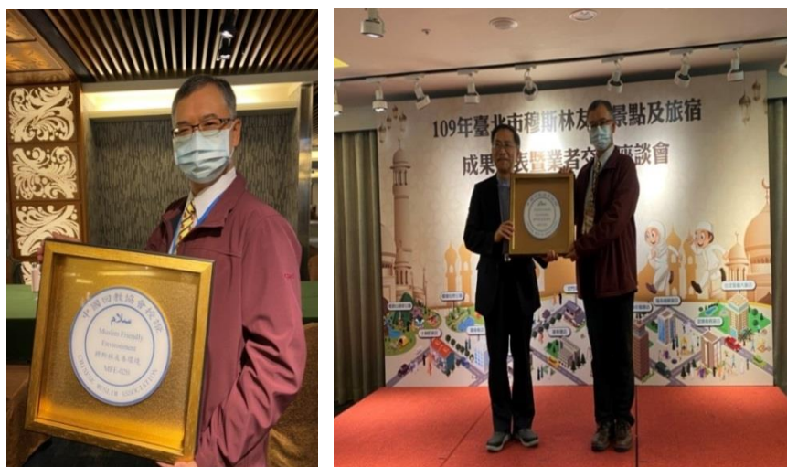
▲ 提供穆斯林友善環境/109 年臺北市穆斯林友善景點的認證完成