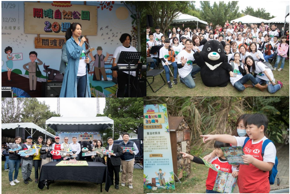
▲ 關渡自然公園 20 週年