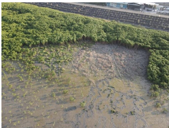
▲蘆洲灘地水筆仔疏伐