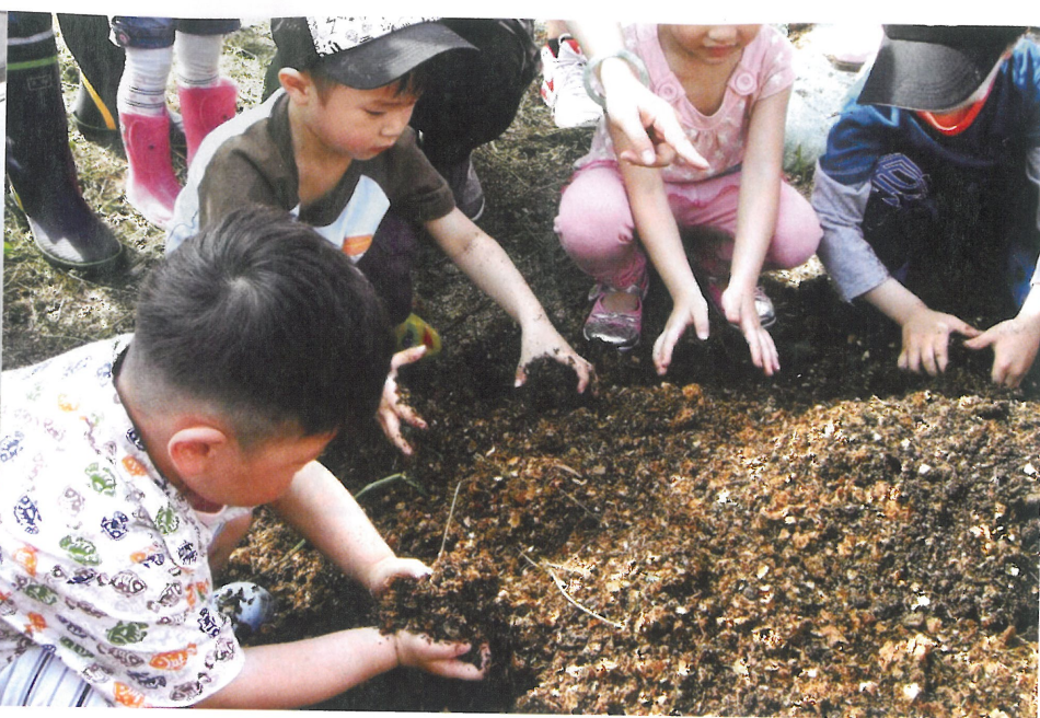
白石湖社區親子農務體驗營，成為親子共同體驗農事、親近自然的最佳去處。

不滿及危機意識化為實際改革力量，原本的老人安養院計畫，在居民的爭取下改為公園的設立，閒置土地上三棟原本令居民好奇不已的糖倉建築，紅磚疊造的拱形古門、28根扶壁、牛眼窗等珍貴建築特色，於2003年獲臺北市文化局指定為市定古蹟。