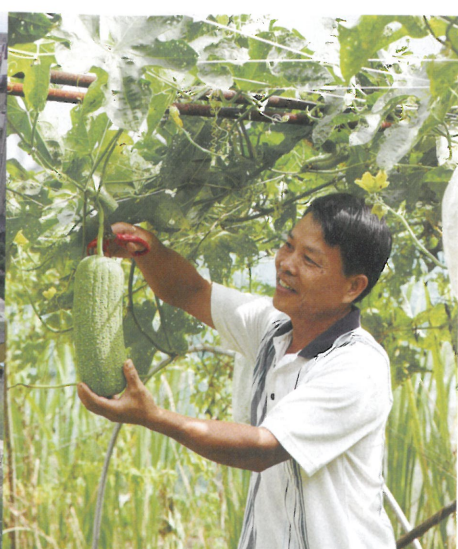
白石湖社區小而美的有機農業備受肯定。

現臺北在環境保育、綠建築、古蹟再生、社區再造的精彩工作成果，不僅值得一訪，其得獎細節也可供民眾日常生活參考學習，讓更多美好宜居社區在臺北誕生。