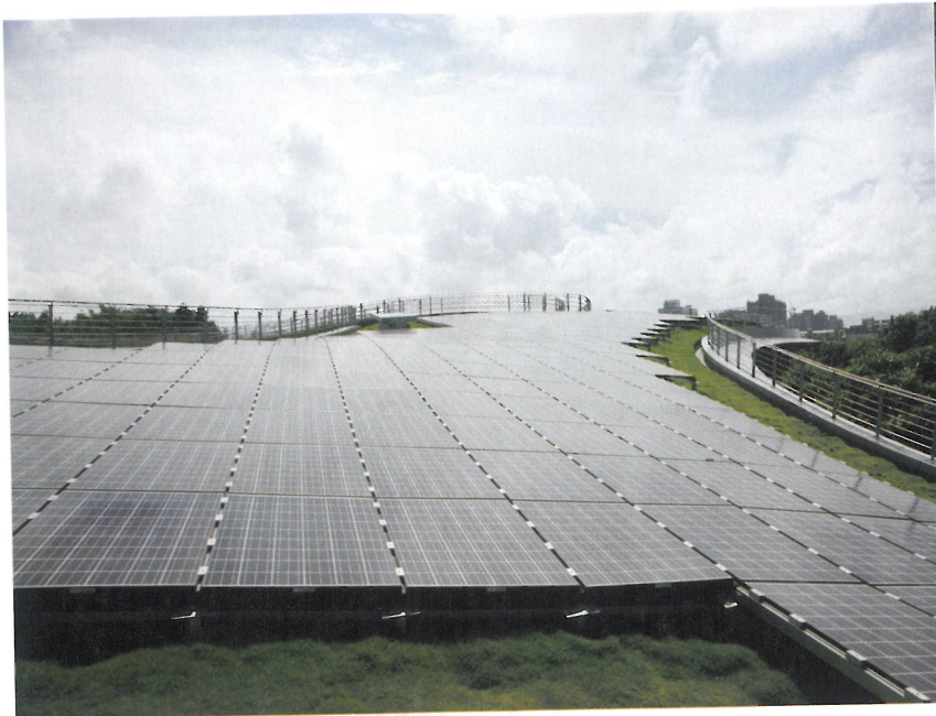
新生三館使用之太陽能光電板為目前全臺北市最大的再生能源裝置。