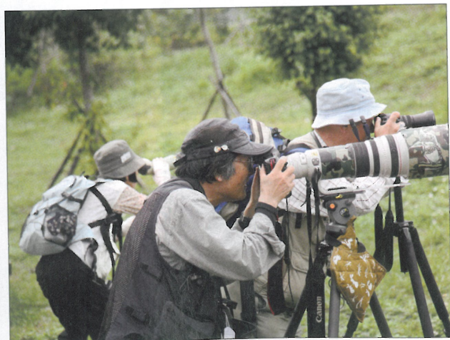
候鳥季節來臨，透過高倍望遠鏡可一睹野鳥齊聚的風采。（王能佑攝）