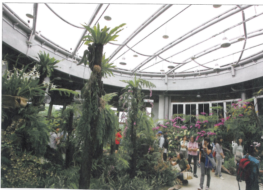
未來館使用的薄膜屋頂讓室內植物可充分吸收陽光。