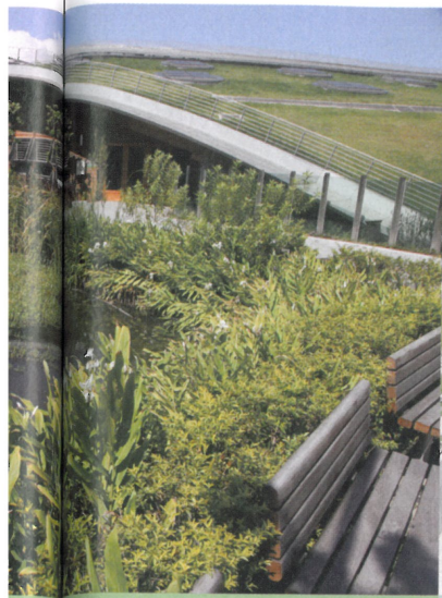
花博新生三館是綠建築最佳典範。