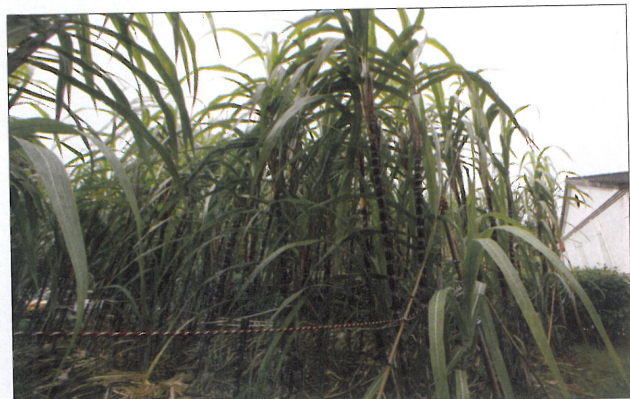
糖廊社區至今仍遺留過去製糖時的許多遺跡。