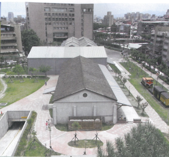
糖廠文化園區是當地居民協力催生的美好果實。