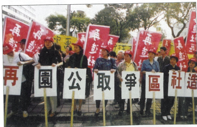
糖廊社區居民將家園環境的危機意識化為實際的行動力量。

位於萬華的糖廊社區，於1997年底因大型老人安養院進駐問題，讓社區居民對於家園環境的