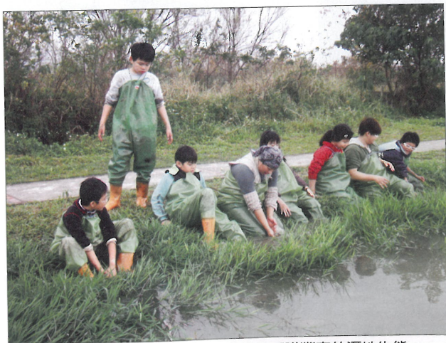
關渡自然公園的寒假營隊活動，讓孩童認識豐富的溼地生態。

Bursary Award（補助獎），評選標準包括自然人文景觀的改善、在地特色文化的保存、環保創新措施、社區公眾參與及賦權、策略性規劃及未來展望等。臺北市2012年共4個案例進入決賽，並全數得獎，包括關渡自然公園、花博新生三館獲得個案類銀質獎，而糖廍及白石湖社區則獲得全市類銅質獎。這4個獲獎案例各自展