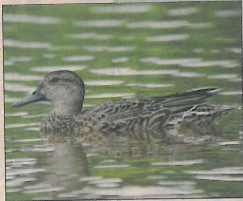
▲小水鴨剛抵達臺灣時，身上是樸素的飛行羽(左)，為了求偶，會換成亮麗的夏羽(上)。