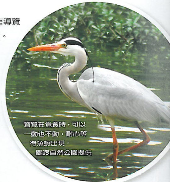
蒼鷺在覓食時，可以一動也不動，耐心等待魚蝦出現。

候鳥就是會隨季節變化而集體遷移的鳥類。牠們在秋天的時候飛往溫暖的南方；隔年春天再返回北方的故鄉。例如：小水鴨來自高緯度的西伯利亞，那裡每到冬天就會變成一片雪白的世界，氣溫甚至會下降到攝氏零下50度。由於小水鴨在冰封的湖面上覓食不易，所以必須冒著長途遷徙的危險，千里迢迢來到氣候溫暖、食物充足的台灣過冬。