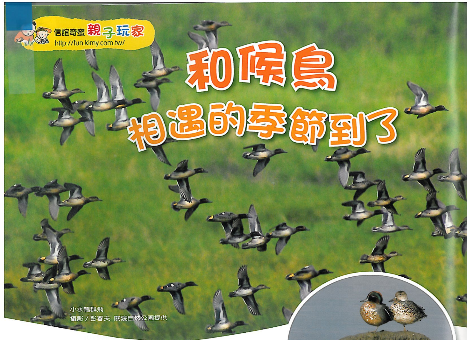
小水鴨群飛